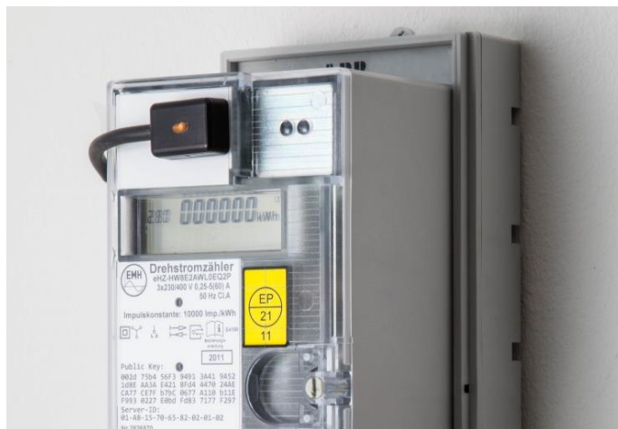
Adapter auf Zähler montiert

Zur Kontrolle der Ausrichtung ist eine gelbe Kontroll-LED vorhanden, die die eingangsseitigen Impulse des Zählers wiedergibt.