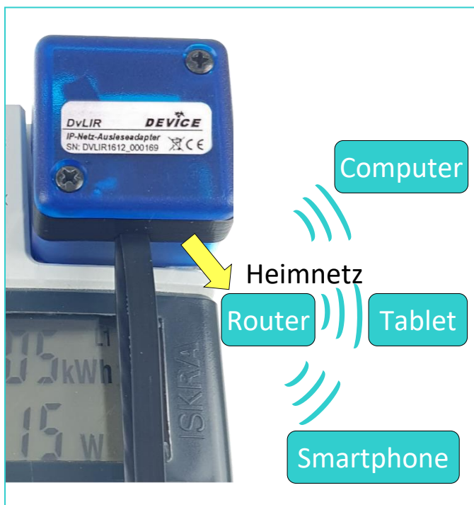
Beispielfunktion des DvLIR